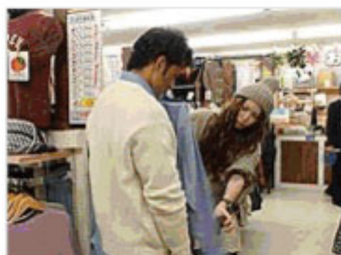
女性店員が女子ウケコーディネート を伝授